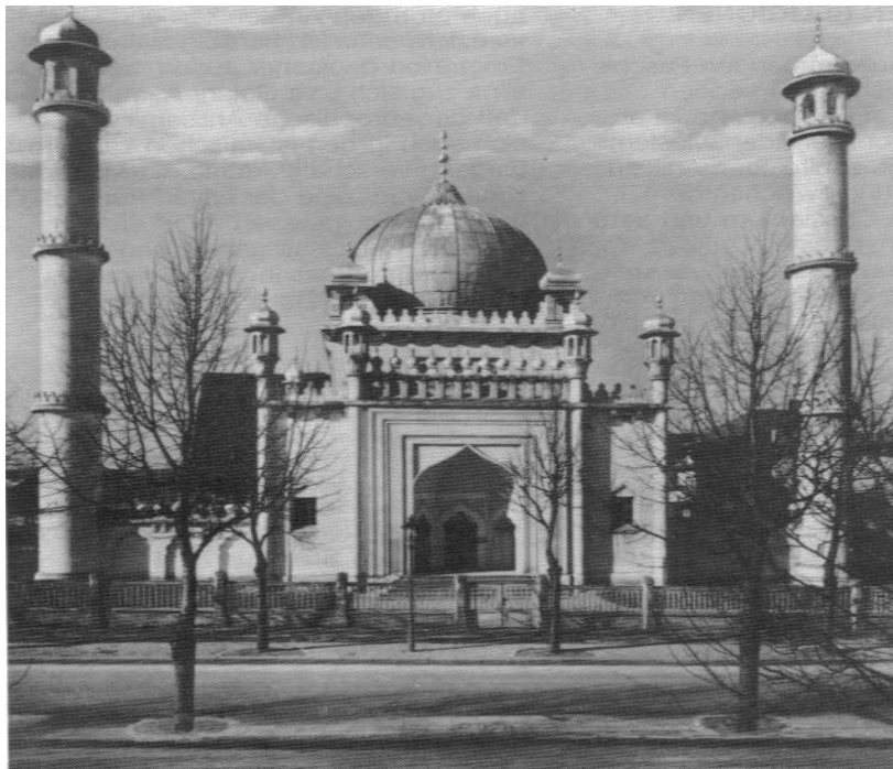
Moschee, Brienner Straße, Berlin-Wilmersdorf, eingeweiht 1927

Bereits 1929 sei sein autobiografischer Roman "Öl und Blut im Orient" erschienen. Ein Jahr darauf kamen "Zwölf Geheimnisse im Kaukasus" heraus. Damit habe er sein Thema gefunden: Russland und die islamische Welt . Seine Stalin-Biografie wurde 1931 publiziert, anschliessend die über jenen arabischen Propheten, der über Jahrhunderte die Geschichte prägen sollte.